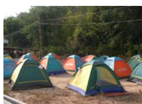
เต็นท์ ที่พักอาศัยชั่วคราว