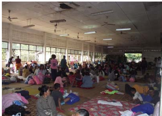
อาคารหอประชุม เป็นที่พักอาศัยชั่วคราว

เช่น โรงเรียน สำนักงาน สนามกีฬา หรือ แม้แต่ตู้รถไฟ และรถบรรทุก เพื่อใช้เป็นศูนย์กลางการอพยพในระยะสั้น อาคารที่ใช้เป็นศูนย์อพยพชั่วคราว จะต้องตรวจสอบว่าโครงสร้างมีความแข็งแรงเพียงพอ และไม่อยู่ในบริเวณที่อาจจะเกิดน้ำท่วมซ้ำ ควรมีสาธารณูปโภคพื้นฐานที่จำเป็น เช่น ระบบน้ำประปา ห้องน้ำ/ห้องส้วม และอาจจะมีโรงครัว ซึ่งสิ่งต่างๆเหล่านี้จำเป็นอย่างยิ่งที่จะต้องมีการบำรุงรักษาอย่างดี พร้อมใช้งาน และทำความสะอาดสม่ำเสมอ เพื่อป้องกันการเกิดโรคระบาด