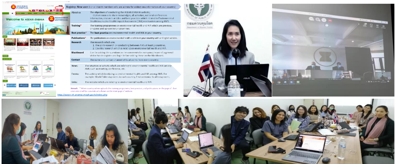
การขับเคลื่อนงานอนามัยสิ่งแวดล้อม ภายใต้กรอบความร่วมมือ ASEAN Health Cluster 2: Responding to All Hazards and Emerging Threats

ต่อมาการประชุม ASEAN Health Cluster 2 ครั้งที่ 6 (The 6 th Meeting of ASEAN Health Cluster2: Responding to All Hazards and Emerging Threats) ระหว่างวันที่ 24 – 26 พฤศจิกายน 2563 ผ่านระบบ Video Conference จากเมืองจาการ์ตา ซึ่งจัดโดยกระทรวงสาธารณสุข ประเทศฟิลิปปินส์ ในฐานะประธาน ASEAN Health Cluster 2 เพื่อติดตามความก้าวหน้าการดำเนินงานกิจกรรมภายใต้แผนความร่วมมือระยะ 5 ปี (Work Programme for 2016 to 2020) และจัดทำแผนความร่วมมือฉบับใหม่ (Work Programme for 2021 to 2025) โดยกรมอนามัย ได้รายงานความก้าวหน้าการดำเนินงานโครงการ Strengthening Environmental Health Network and Empowering Health Impact Assessment (HIA) 2019-2020 ภายใต้ Health Priority 11 ซึ่งได้มีการพัฒนาเว็บไซต์ ASEAN-EH&HIA เพื่อเป็นช่องทางสำหรับการแลกเปลี่ยนข้อมูลองค์ความรู้ และตัวอย่างที่ดี ด้านอนามัยสิ่งแวดล้อม และการประเมินผลกระทบต่อสุขภาพระหว่างประเทศสมาชิกอาเซียน โดยที่ประชุมเห็นชอบและเสนอให้มีการเชื่อมโยง link ของเว็บไซต์ดังกล่าวกับเว็บไซต์ Public Health Emergency ของอาเซียน ปัจจุบันมีประเทศสมาชิกสมัครเป็น Admin แล้ว 5 ประเทศ