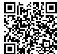
(QR Code Website)