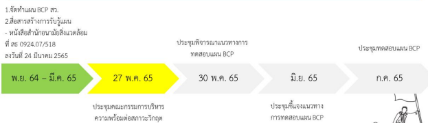
Timeline: การดำเนินงานตัวชี้วัดที่ 2.1 ระดับความสำเร็จของกรควบคุมภายในและแผนบริหารความต่อเนื่อง (BCP)

ที่ประชุมฯ มีการแลกเปลี่ยนเรียนรู้ ให้ข้อคิดเห็นการกำหนดรูปแบบในการทดสอบแผนรูปแบบ Tabletop testing และกำหนดเหตุการณ์สมมติ คือ เหตุการณ์อัคคีภัย ทั้งนี้ มอบหมายทีมเลขานุการดำเนินการจัดทำ (ร่าง) แนวทางสำหรับการทดสอบดำเนินธุรกิจอย่างต่อเนื่อง (Business Continuity Plan: BCP) สำนักอนามัยสิ่งแวดล้อม โดยเพิ่มเติมประเด็นข้อเสนอจากที่ประชุมให้มีความครอบคลุมนำเสนอต่อคณะกรรมการบริหารของสำนักอนามัยสิ่งแวดล้อมเพื่อพิจารณาเห็นชอบต่อไป