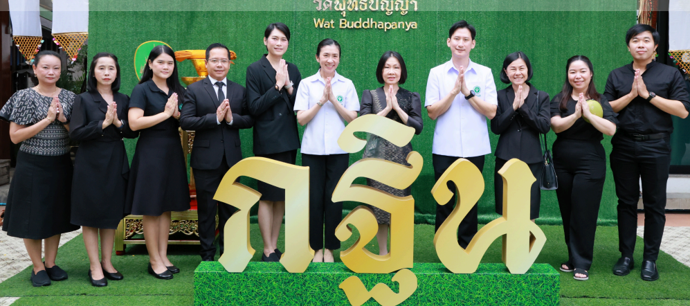
วัดพุทธปัญญา Wat Buddhapanya